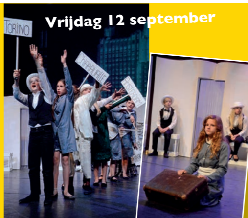
Vrijdag 12 september